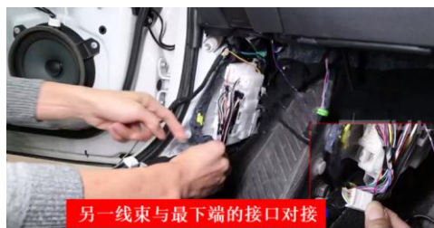
另一线束与最下端的接口对接