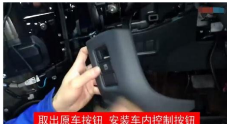
取出原车按钮 安装车内控制按钮