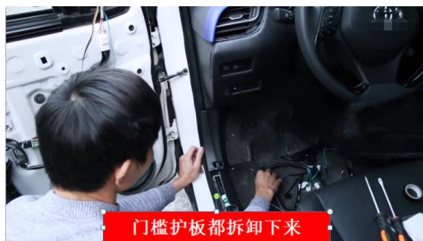
门槛护板都拆卸下来