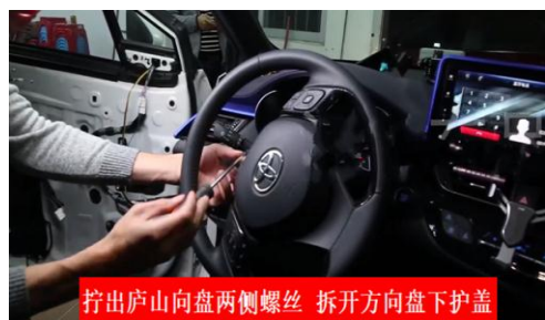
拧出庐山方向盘两侧螺丝 拆开方向盘下护盖