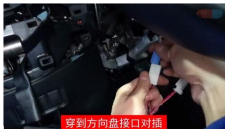
穿到方向盘接口对插