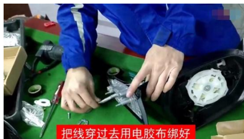
把线穿过去用电胶布绑好