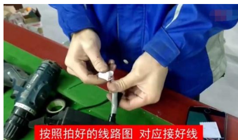
按照拍好的线路图 对应接好线