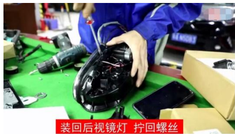
装回后视镜灯 拧回螺丝