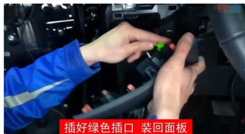
插好绿色插口 装回面板