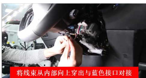
将线束从内部向上穿出与蓝色接口对接