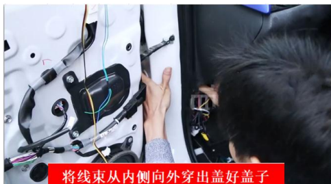
将线束从内侧向外穿出盖好盖子