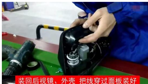
装回后视镜、外壳 把线穿过面板装好