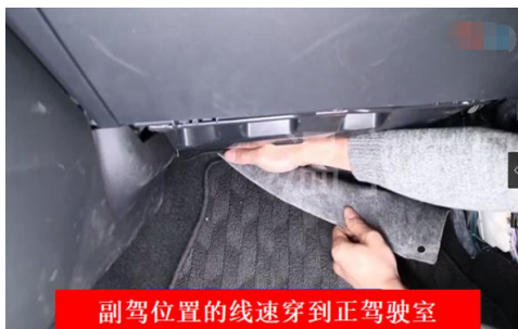
副驾位置的线束穿到正驾驶室