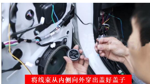
将线束从内侧向外穿出盖好盖子