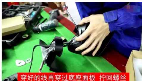
穿好的线再穿过底座面板 拧回螺丝