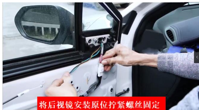
将后视镜安装原位拧紧螺丝固定