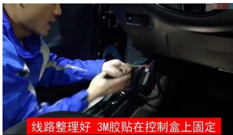
线路整理好 3M胶贴在控制盒上固定